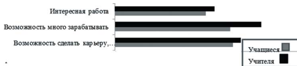
Диаграмма 3. Предпочтения в мотивациях при выборе профессии

Учитывая изложенные обстоятельства, можно легко спрогнозировать ответы гродненских старшеклассников на вопрос о предпочитаемых сферах трудоустройства. Подростковая романтика сталкивается с прагматическим взглядом на жизнь в господствующем мнении респондентов о выборе такого вида профессиональной деятельности, как организация своего бизнеса. В пятерке предпочтительных сфер трудоустройства, как подтверждение изложенной выше тенденции, разместились «сервис и услуги», «финансово-банковские услуги», «управление». И только «образование и культура» выпадают из этого ряда, на что недвусмысленно указывают педагогические работники (Диаграмма 4).