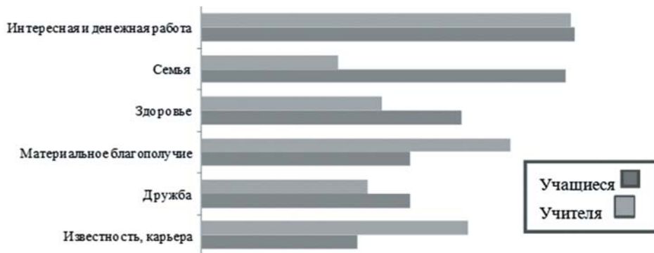
Диаграмма 1. Приоритетные ценности учащихся

Учителя, основываясь на школьном опыте, скромнее оценивают эти качества, предпочитая думать о том, что в школьной обстановке чаще формируются «люди, добивающиеся в жизни своего».